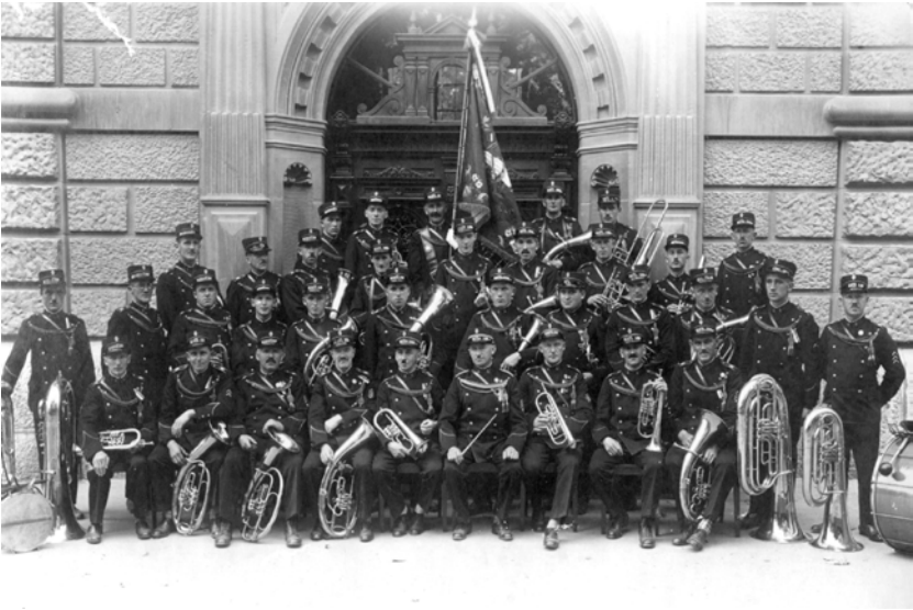
Die Konkordia am Eidg. Musikfest in Bern 1931.