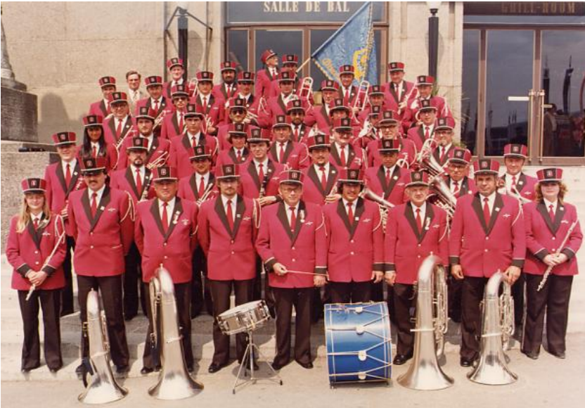
Am Eidg. Musikfest in Lausanne 1981

1988: Durchführung des 70. Musiktages des Musikverbandes Thal-Gäu. Vereinsreise auf den Ballenberg.