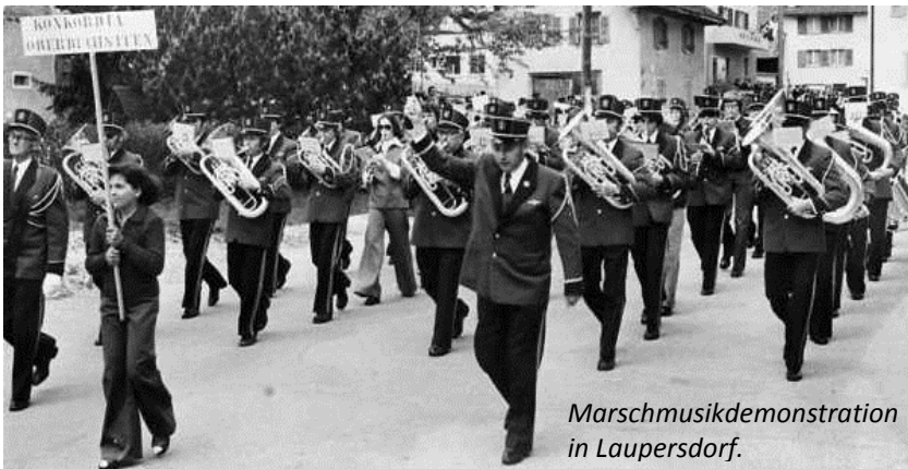
Marschmusikdemonstration in Laupersdorf.

1976: Konzert und verschiedene Auftritte anlässlich des Soloth. Kantonal-Schützenfestes in Oberbuchsiten. Bezirks-Musiktag in Laupersdorf.