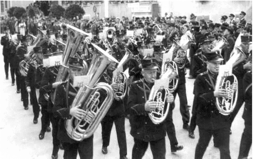
1947: Am Soloth. Kantonal-Musikfest in Balsthal im 1. Rang in der 2. Klasse.