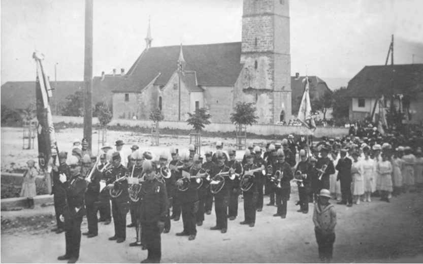
Die erste Uniform der „Konkordia Oberbuchsiten“ am Umgang an Maria Himmelfahrt um 1920

1920: Am Musikfest in Balsthal im 3. Rang.