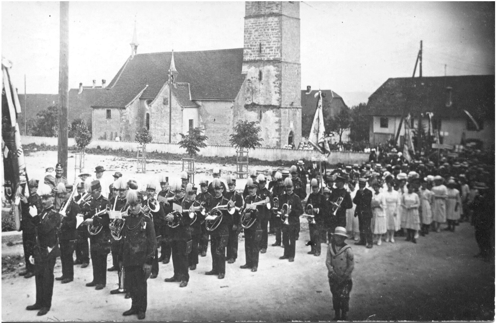
Umgang an Maria Himmelfahrt: Musikgesellschaft, Kirchenchor, getragene Marienstatue, Vereine und Volk (bis ins Jahr 1934)