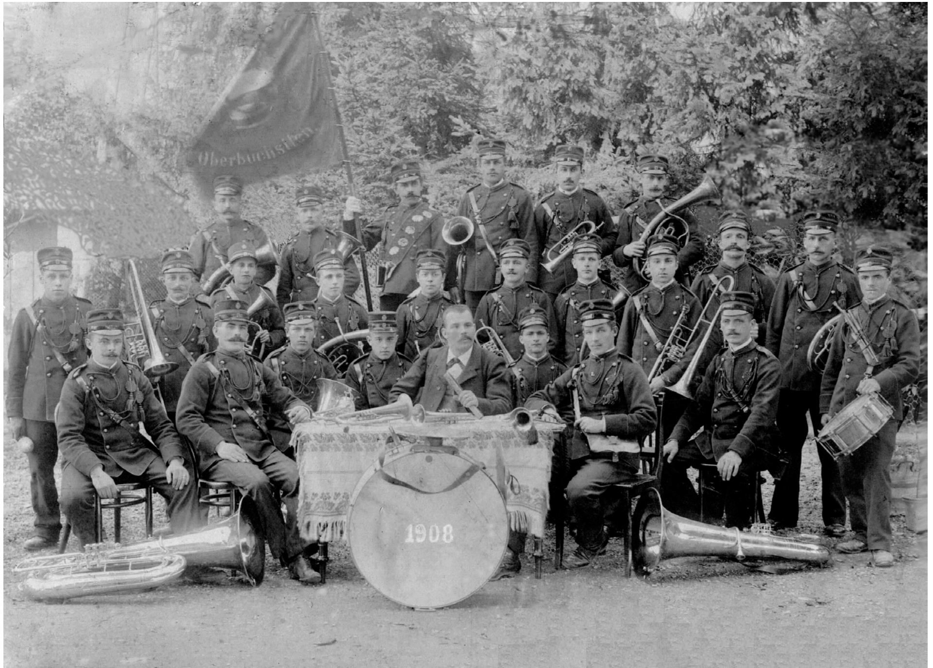
Die freisinnige Musikgesellschaft Oberbuchsiten im Jahre 1908