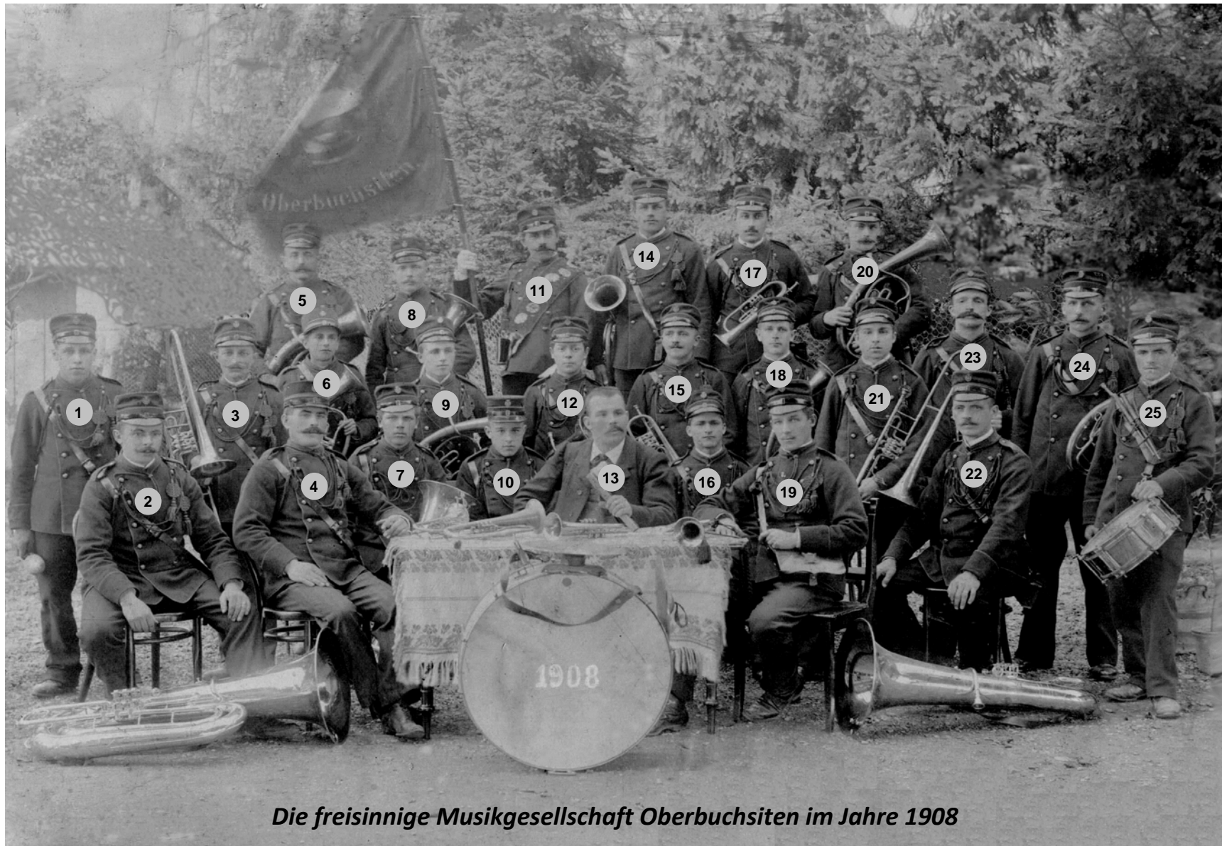
Die freisinnige Musikgesellschaft Oberbuchsiten im Jahre 1908