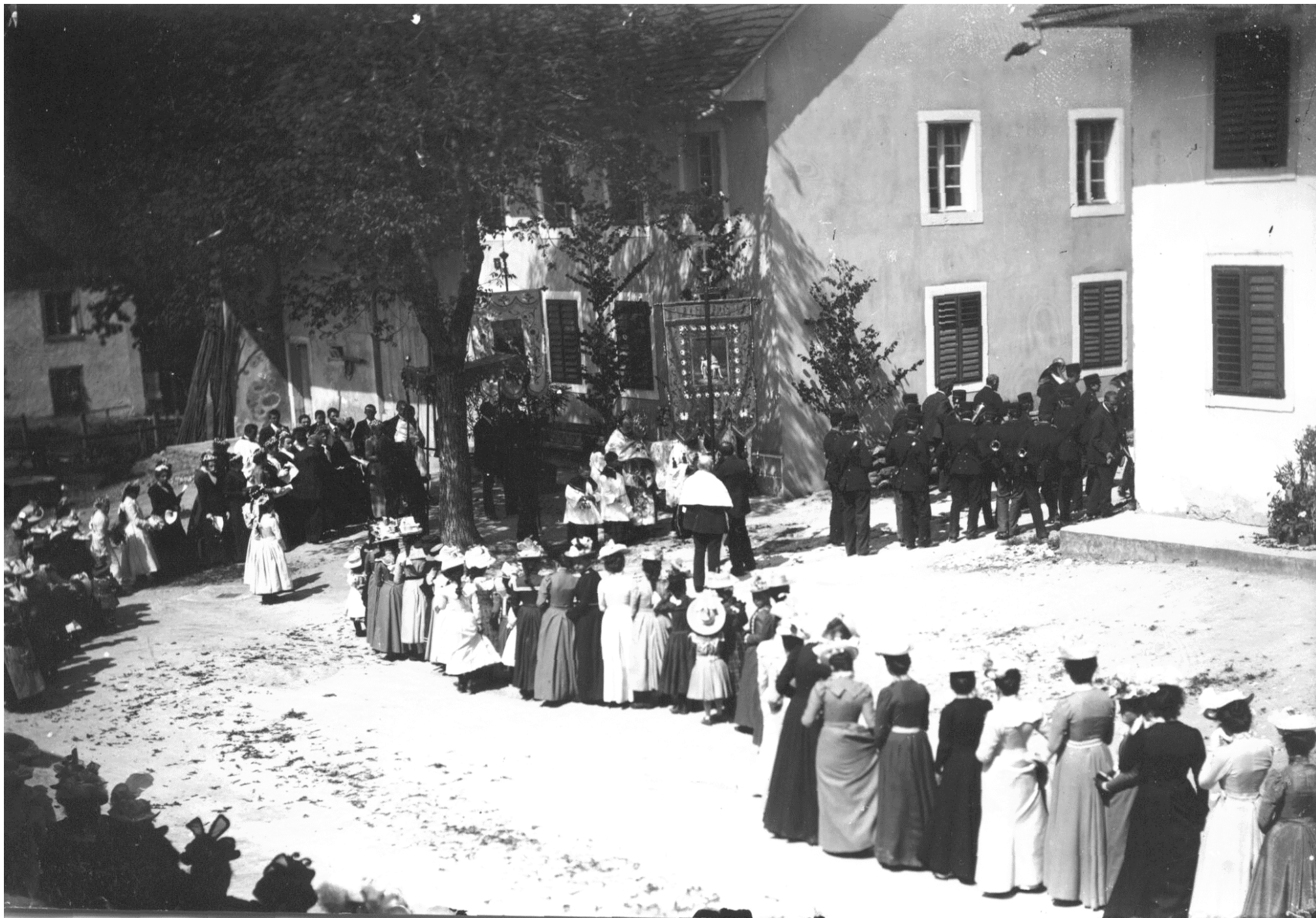
Prozession Hauptstrasse – Bachstrasse um 1910