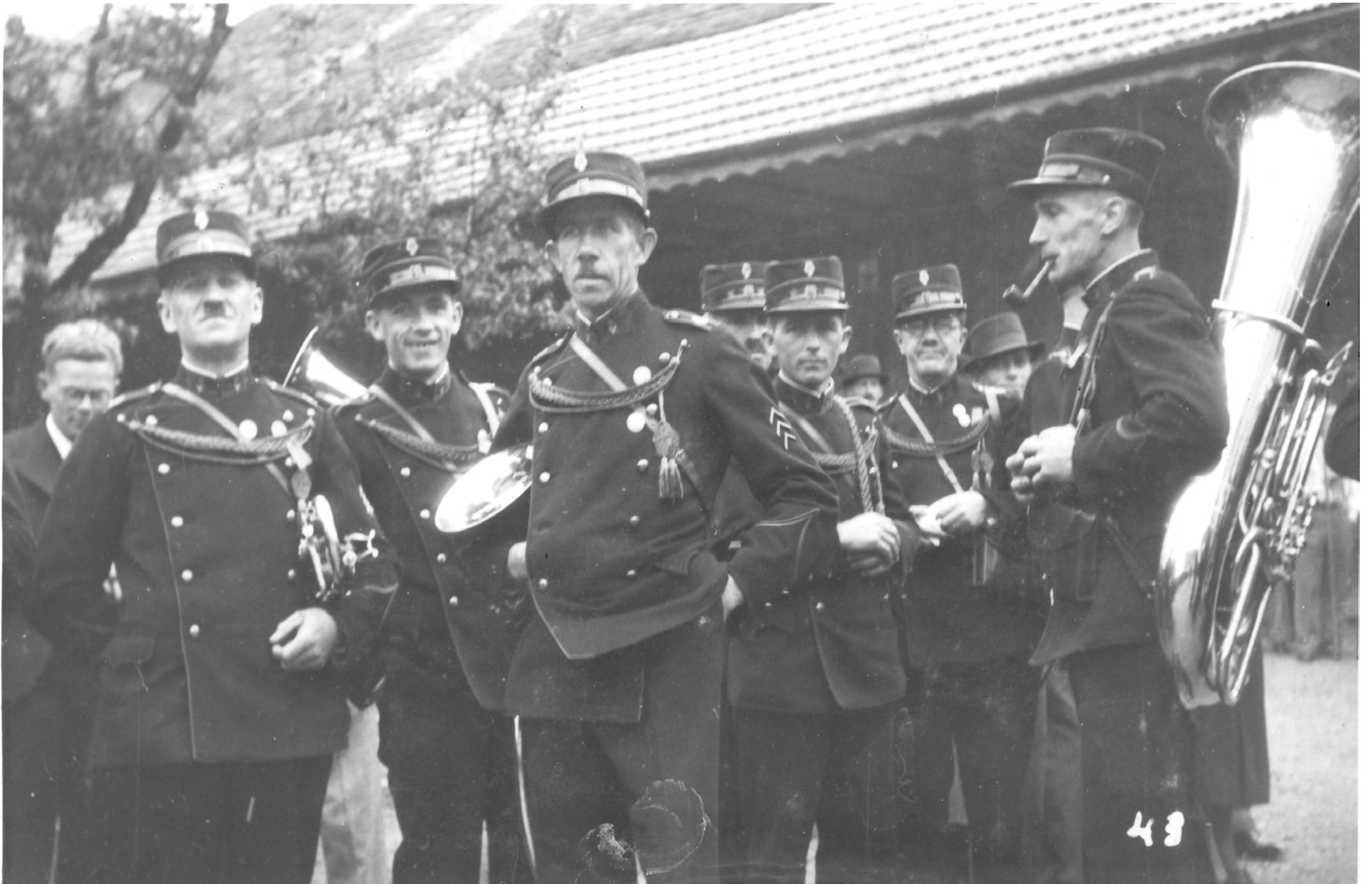
Musikgesellschaft Oberbuchsiten (unbekannte Mitglieder anno ....)