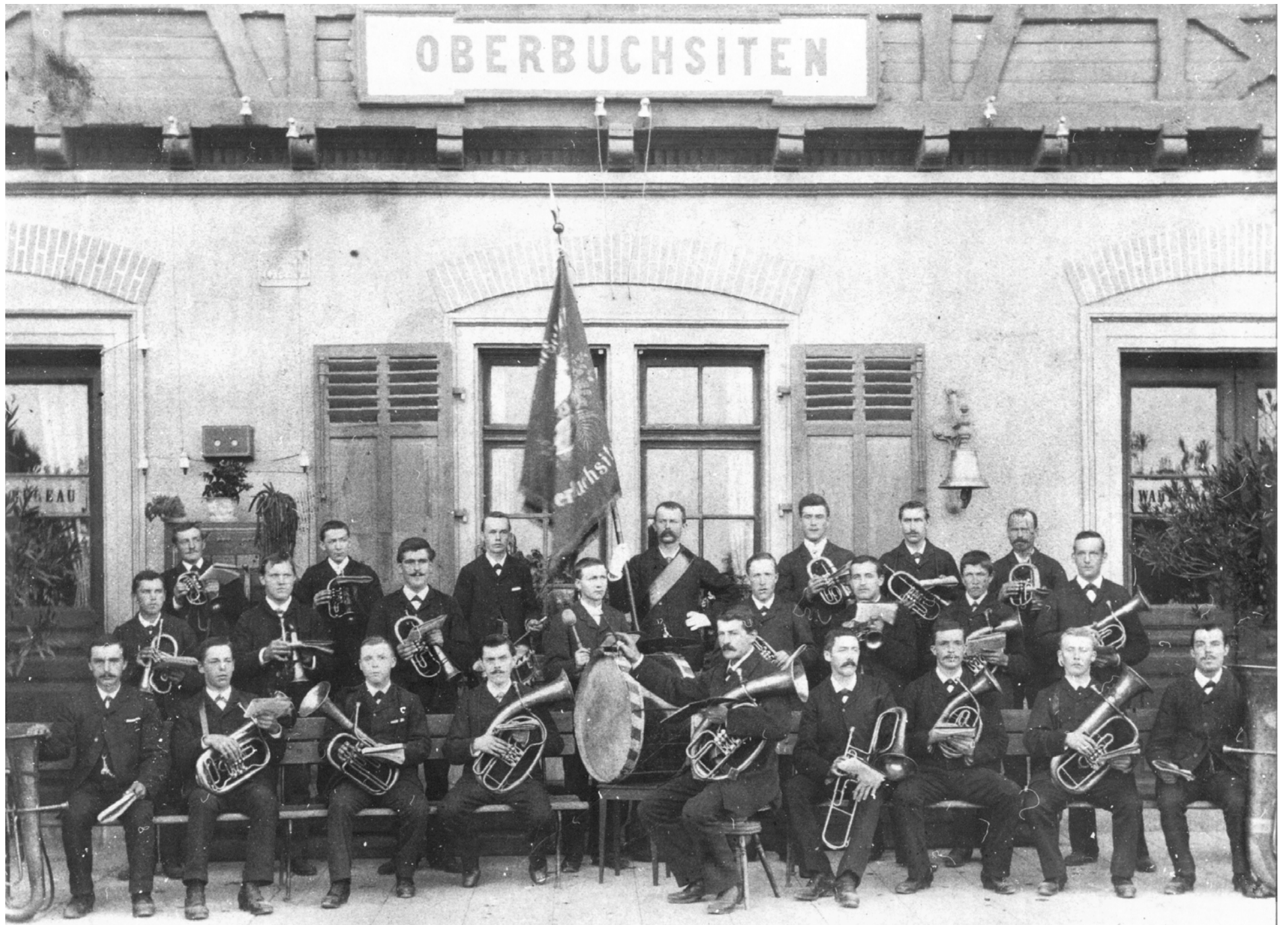
Die Musikgesellschaft Oberbuchsitzen am 29. Oktober 1893