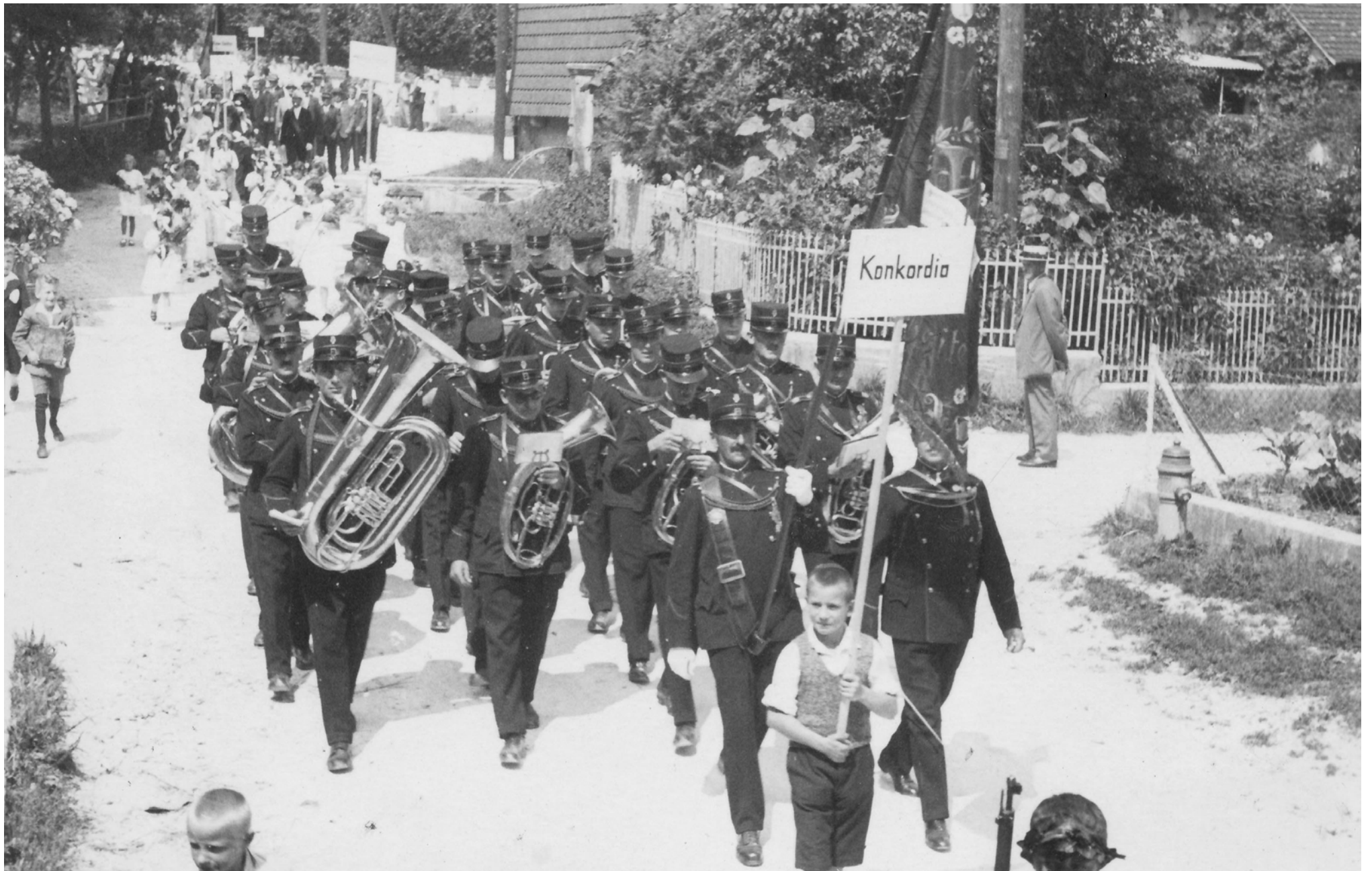
Umgang an Maria Himmelfahrt: Musikgesellschaft, Kirchenchor, getragene Marienstatue, Vereine und Volk (bis ins Jahr 1934)