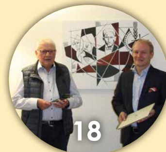
Raiffeisen früher und in Zukunft