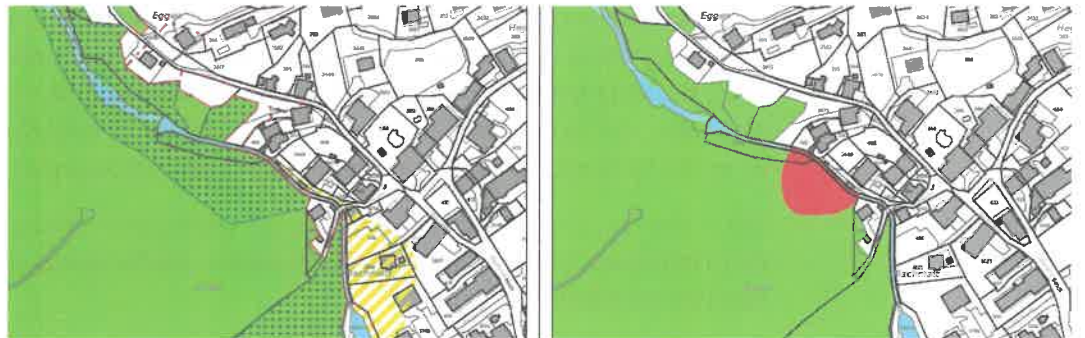
Abbildung 3: Anpassungen Naturgefahrenplan Steinschlaggebiet Rüteli. In der OPR eingereicherter Gefährdungsbereich (links) und neuer Gefährdungsbereich mit der vorliegenden Änderung (rechts)