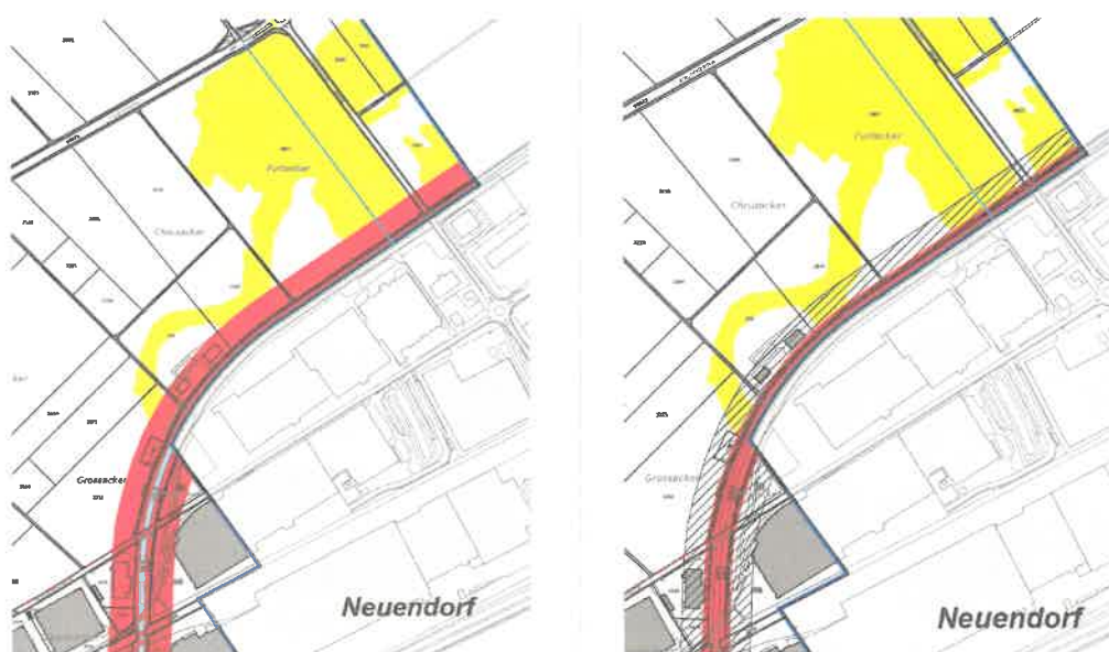
Abbildung 1: Ausschnitt Anpassung Bereich Dünnern. Links: Naturgefahrenplan rechtsgültig; rechts: Naturgefahrenplan neu mit Hinweisbereich Ufererosion

Die Ausdehnung eines Hochwasserereignis mit Ufererosion ist schwierig zu bestimmen, da oftmals verschiedene Prozesse zur selben Zeit auftreten. Bei der Überarbeitung der Gefahrenkarte Hochwasser Dünnern im Jahr 2015 wurde der Bereich der Ufererosion grosszügig ausgedehnt und als Bereich erheblicher Gefährdung (rot) ausgewiesen. Die Gegebenheiten wie Strassen, Gebäude etc. wurden bei nachgängiger Betrachtung zu wenig berücksichtigt. Im Jahr 2021 wurde seitens des Kantons beschlossen, den Bereich Ufererosion entlang der Dünnern zu reduzieren und teilweise nur noch als Hinweis (orientierend) im Naturgefahrenplan darzustellen. Die Gemeinde Oberbuchsiten hat erst nach Auflage und Beschluss der Ortsplanungsrevision inkl. Naturgefahrenplan von der geänderten Praxis erfahren. Eine Anpassung war nicht mehr möglich. Im angepassten Naturgefahrenplan wird der Bereich der erheblichen Gefährdung (rot) entlang der Dünnern entsprechend reduziert und die angrenzenden Bereiche sind neu als «Hinweisbereich Ufererosion» ausgewiesen.