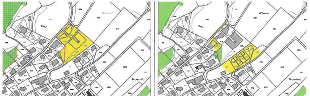
Abbildung 2: Anpassungen Naturgefahrenplan Rutschgebiet Wilweid. In der OPR eingereicherter Gefährdungsbereich (links) und Erweiterung des Gefährdungsbereichs mit der vorliegenden Änderung (rechts)

Gegenüber dem Stand der Ortsplanungsrevision werden im Naturgefahrenplan folgende Anpassungen vorgenommen: